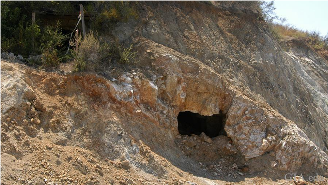
ورودی تونل قدیمی در معدن تورمالین کینگ.

در ایالات متحده، هر دو کالیفرنیا جنوبی و مین (Maine ایالتی در شمال شرقی ایالات متحده، در اقیانوس اطلس) میزبان چندین ناحیه پگماتیت هستند. برای بیش از یک قرن است، این منطقه به طور پراکنده مقادیر زیادی تورمالین تولید می‌کند. اولین ذخایر بزرگ تورمالین مین در سال ۱۸۲۰ در کوه میکا در پاریس توسط دو پسر جوان در حال کاوش در منطقه محلی کشف شد. حتی امروزه، معدنی در کوه میکا به‌طور متناوب رنگ‌های مختلف تورمالین جواهر تولید می‌کند. معدن دانتون، در نزدیکی کوه پلمباگو (Plumbago)، پرکارترین تولیدکننده تورمالین در مین است.