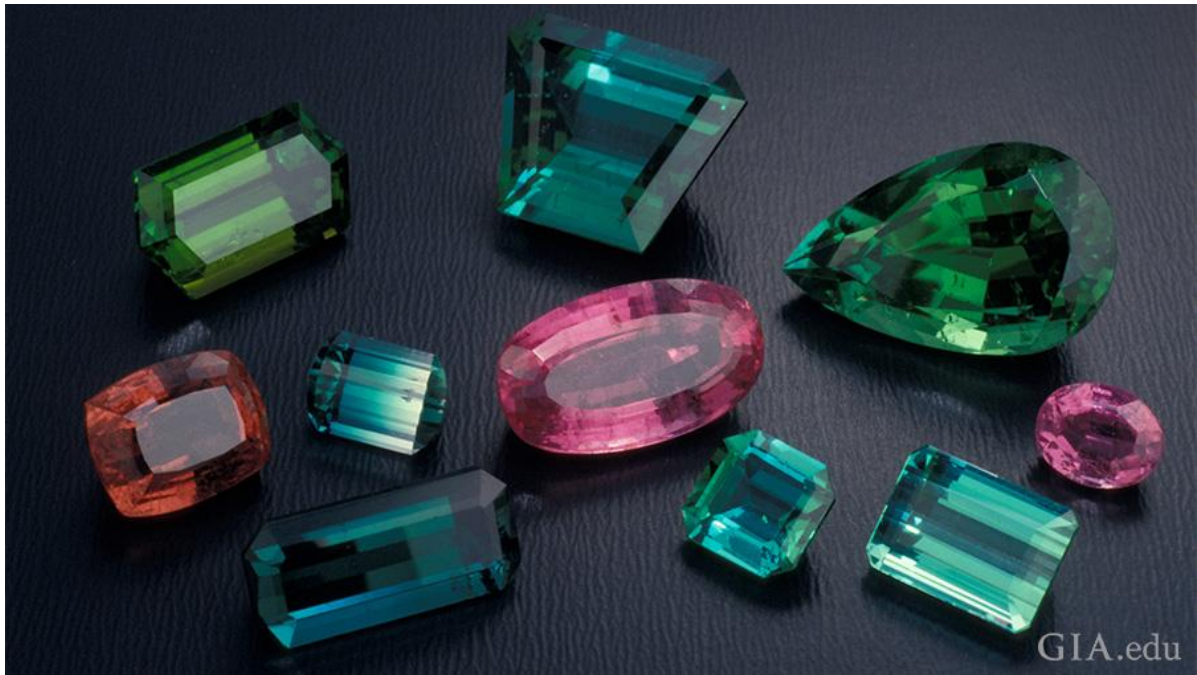
مجموعه‌ای از تورمالین چند رنگ.

تصور می‌شود که رنگ‌های مختلف تورمالین خواص درمانی خاص خود را دارند. اعتقاد بر این است که تورمالین سیاه از پوشنده محافظت می‌کند و حس اعتماد به نفس را ایجاد می‌کند. تورمالین صورتی مظهر عشق است و با شفقت و ملایمت همراه است. تورمالین سبز باعث افزایش شجاعت، قدرت و استقامت می‌شود. تورمالین برای جشن هشتمین سالگرد ازدواج داده می‌شود.