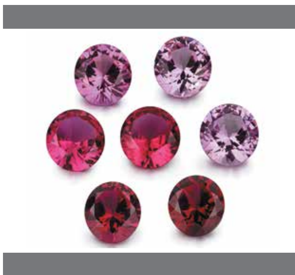
یاقوت، سنگ تولد ماه جولای

از نظر تاریخی، سنگ تولد ماه ژوئن، مروارید بوده است. این سنگ قیمتی ارگانیک دارای سابقه طولانی در استفاده از جواهرات است که تا به امروز ادامه دارد. بسیاری از افسانه‌ها و اسطوره‌ها نیز در اطراف مروارید رشد کرده‌اند. با این حال، الکساندریت، یک تازه وارد به دنیای جواهرات، جای خود را در لیست مدرن باز کرده است.