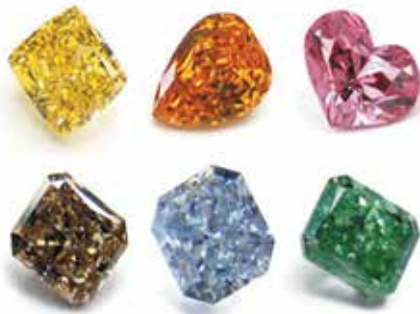
الماس، سنگ تولد ماه آوریل