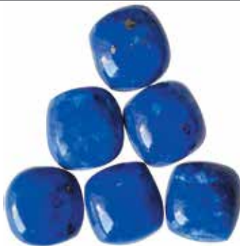
لاجورد، سنگ تولد ماه دسامبر

تورمالین سنگ تولد مدرن ماه اکتبر است. این جواهرات در انواع و رنگ‌های بسیاری از جمله سنگ‌های چند رنگ زیبا وجود دارد.