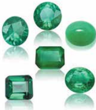
زمرد سنگ تولد ماه می

آوریل به الماس معروف به عنوان سنگ تولد سنتی و مدرن خود می‌بالد. شما می‌توانید الماس‌ها را کمابیش در هر سایه‌ای که تصور کنید، پیدا کنید. رنگ‌های آن از شفاف تا سیاه و هر رنگ رنگین‌کمان در بین آن متغیر است. اگرچه الماس‌های بی‌رنگ محبوب‌ترین انتخاب جواهرات هستند، رنگ‌های دیگر مانند زرد، شامپانی و قهوه‌ای در حال افزایش هستند.