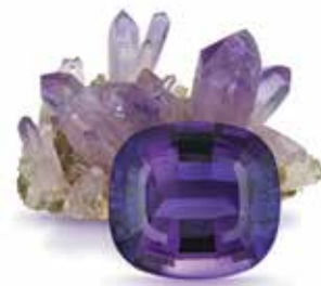
سنگ تولد ماه فوریه

زمرد، سنگ ماه می، دارای نمادهای غنی از جمله ارتباط با باروری، سلامتی و وفاداری است. این سنگ ماه تولد به عنوان نمادی از تولد دوباره در طول تاریخ عمل کرده است. گفته می‌شود که این جواهر سبز رنگ مورد علاقه کلوپاترا بوده است. طبق باورهای سنتی، این گوهر برای صاحبش آینده‌نگری، جوانی و خوش اقبالی به همراه دارد. بنابراین اگر تولد ماه می دارید، سنگ تولد خود را در سلامت کامل بپوشید.