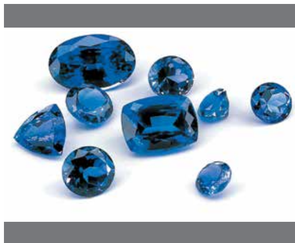
یاقوت کبود، سنگ تولد ماه سپتامبر

پریدوت سنگ تولد مدرن برای ماه اوت است. شما می‌توانید این جواهر را در رنگ‌های مختلف از زرد-سبز تا قهوه‌ای پیدا کنید. با این حال، رقم سبز روشن یا سبز لیمویی قوی‌ترین ارتباط مردمی را با این ماه دارد.