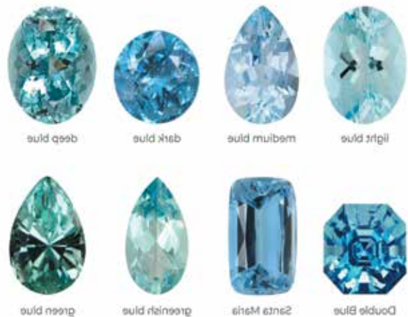
رنگ‌های مختلف آکوامارین

آمتیست تداعی‌های محبوب بسیاری از جمله آرامش و سلطنت دارد. به طور سنتی، اعتقاد بر این است که باعث ایجاد شجاعت و تقویت روابط می‌شود. این سنگ به عنوان سنگ تولد ماه فوریه در لیست سنتی و مدرن ظاهر می‌شود.