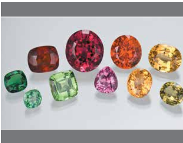
گارنت، سنگ ماه تولد ژانویه

گارنت سنگ تولد سنتی و مدرن ژانویه است. اگرچه گارنت‌ها ترکیبی از گونه‌های معدنی با اشتراکات فراوان هستند، انواع قرمز تیره بیشتر با ژانویه مرتبط است. با این حال، رنگ گارنت‌ها از قرمز تیره و صورتی-بنفش تیره تا زرد، نارنجی و چندین سایه سبز متغیر است. حتی ممکن است یک گارنت آبی بسیار کمیاب پیدا کنید.