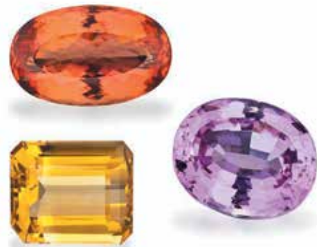
توپاز، سنگ تولد ماه نوامبر