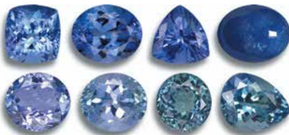
تانزانیت، سنگ تولد ماه دسامبر

روزی روزگاری، قبل از گوهرشناسی مدرن، تمام سنگ‌های زرد رنگ توپاز محسوب می‌شدند. در اوایل قرن بیستم، گوهرشناسان توپاز را به عنوان یک گونه گوهر متمایز تعریف کردند که شامل انواع زرد و همچنین آبی، صورتی، بنفش و دیگر انواع بود. بنابراین، سنگ تولد سنتی نوامبر به نسخه مدرن، توپاز زرد یا طلایی تبدیل شد. با این حال، می‌توانید رنگ توپازی را که بیشتر دوست دارید برای جواهرات سنگ تولد انتخاب کنید.