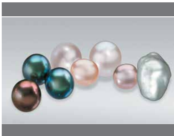
مروارید، سنگ تولد ماه ژوئن

اگرچه بیشتر با آبی مرتبط است، یاقوت کبود در رنگ‌های متنوعی وجود دارد. در واقع، این سنگ ماه تولد سپتامبر، سنتی و مدرن، در هر رنگی به جز قرمز وجود دارد (یاقوت کبود، بنا به تعریف، انواع سنگهای غیرقرمز کوراندوم است). یاقوت‌های کبود تداعی‌های نمادین زیادی و فرهنگ فولکلور غنی دارند. به طور سنتی اعتقاد بر این بود که این سنگ از مردمان در برابر آسیب محافظت می‌کند در قرون وسطی، روحانیون مسیحی یاقوت کبود آبی را به عنوان نماد بهشت می‌پوشیدند برای بسیاری از علاقه‌مندان به جواهر، این جواهرات اکنون نماد خرد، خلوص و ایمان است.