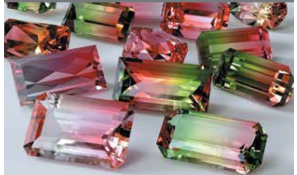
تورمالین، سنگ تولد ماه اکتبر