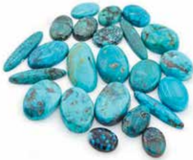
فیروزه، سنگ تولد ماه دسامبر